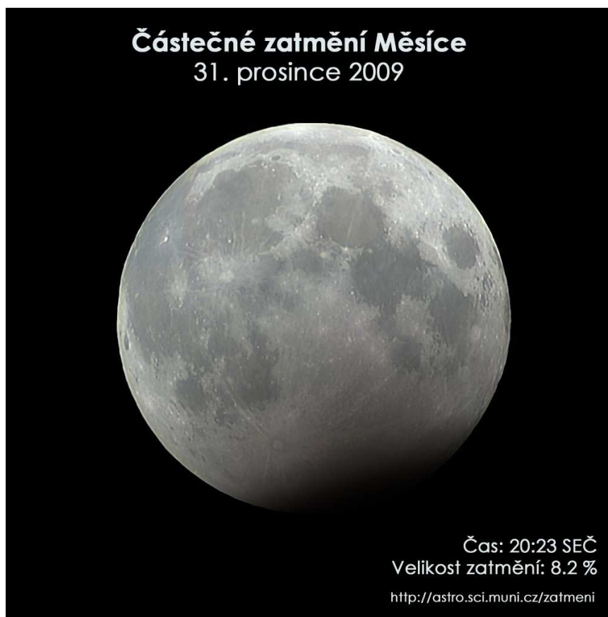
Simulační snímek maximální fáze zatmění.